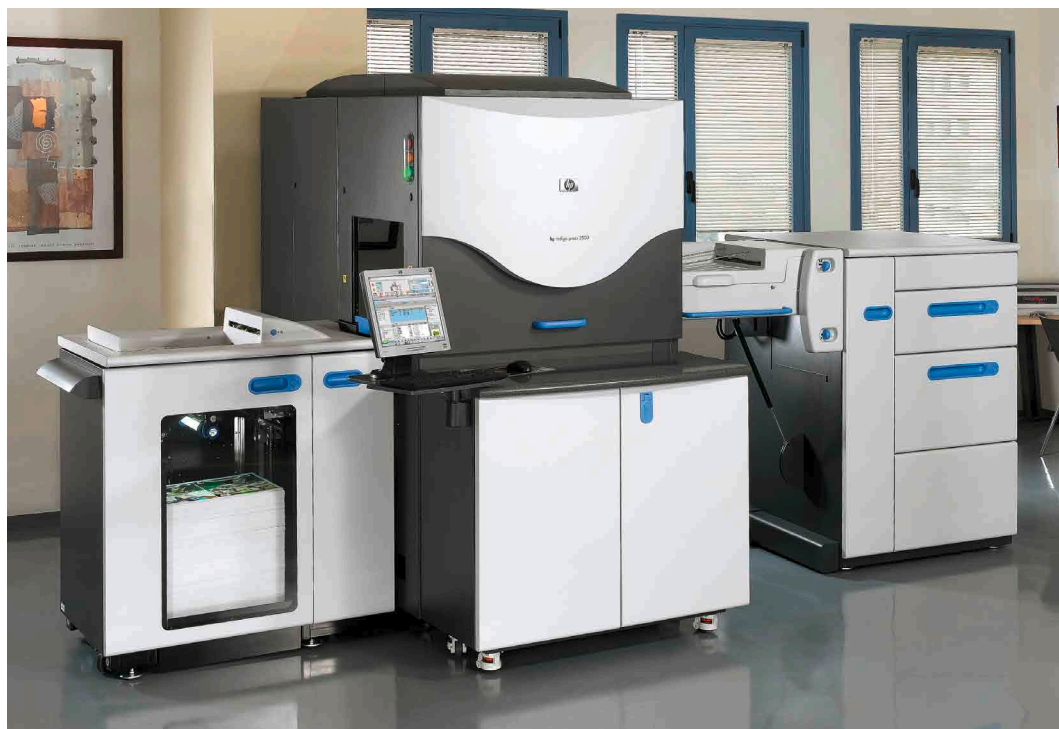
Höchste Zufriedenheit bei Lieferant, Druckerei und Kunde: Eine solche HP Indigo press 3500 wurde Ende August dieses Jahres bei der Suter Print AG in Ostermündigen installiert. Bereits fünf Tage später wurden erste Aufträge gedruckt.